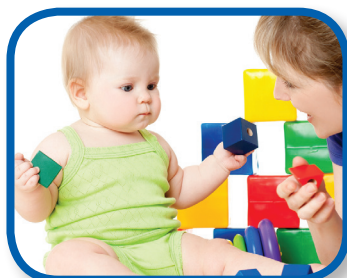
Problem Solving 3-6 months