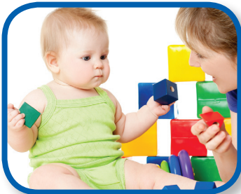
Resolución de problemas De 3 a 6 meses