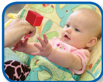
Watch the Block 0-3 months