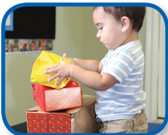
Bloques táctiles De 6 a 12 meses