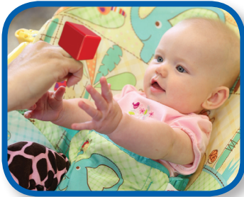
Mira el bloque De 0 a 3 meses