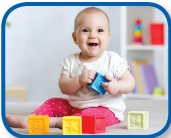
Juego con bloques De 3 a 6 meses